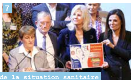
Un moment attendu après deux années d'annulation en raison de la situation sanitaire